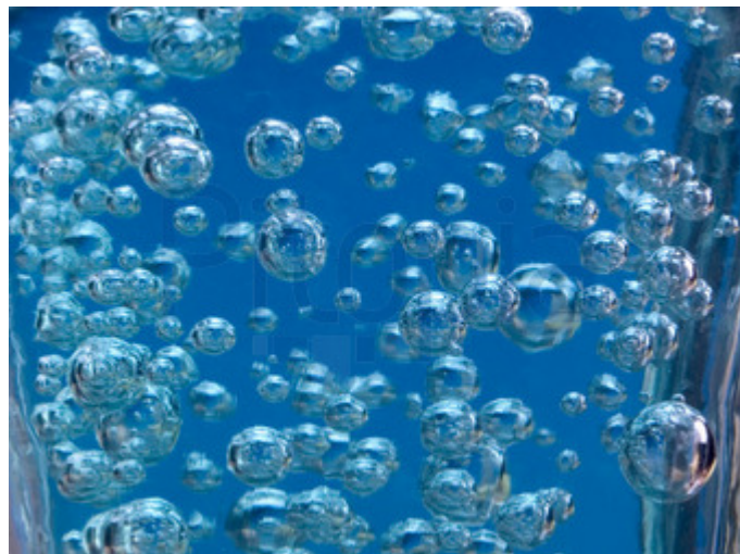
Wasser-Luft-Gemische und deren Wirkung im Wasserbau