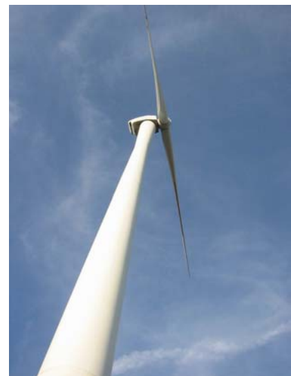
Windrad auf dem Karlsruher Müllberg