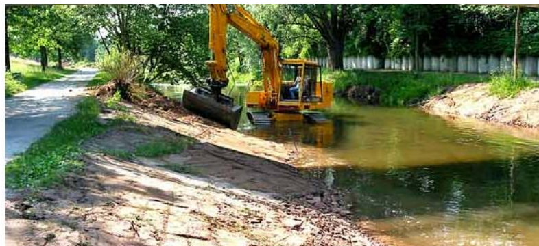
Renaturierung der Alb, (Foto WFBW)

Der Kurs behandelt die sowohl die rechtlichen als auch die organisatorischen Grundschritte von wasserbaulichen Planung. Anhand des Planspieles „Renaturierung des Fließabschnittes der Alb auf Höhe der MIRO-Raffinerie“ werden die Inhalte aus den Impulseinheiten selbst angewendet und vertieft. Exkursionen zu wasserbaulichen Planungen und Bauwerken runden den Vorlesungsinhalt ab.